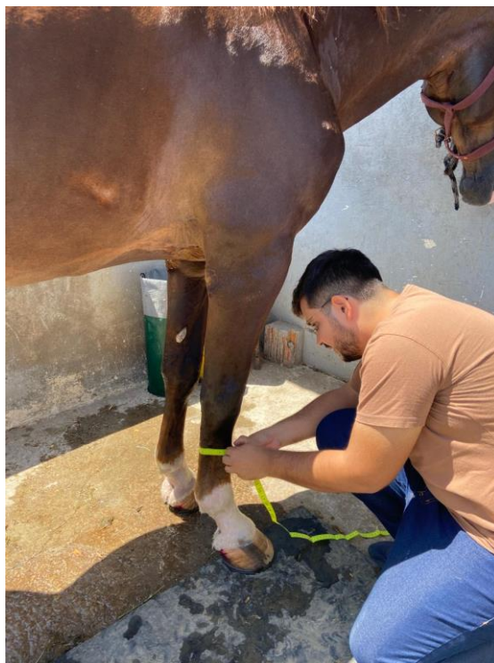
Figura 05- Medição do perímetro de canela

por Maciel (2016), as medições foram feitas com o auxílio de uma fita métrica. As equações utilizadas para predição de peso corporal de machos e fêmeas foram respectivamente P_{(kg)} = 21,48 \times PC_{(cm)} e P_{(kg)} = 22,67 \times PC_{(cm)} , onde: P=peso corporal estimado e PC= perímetro de canela.