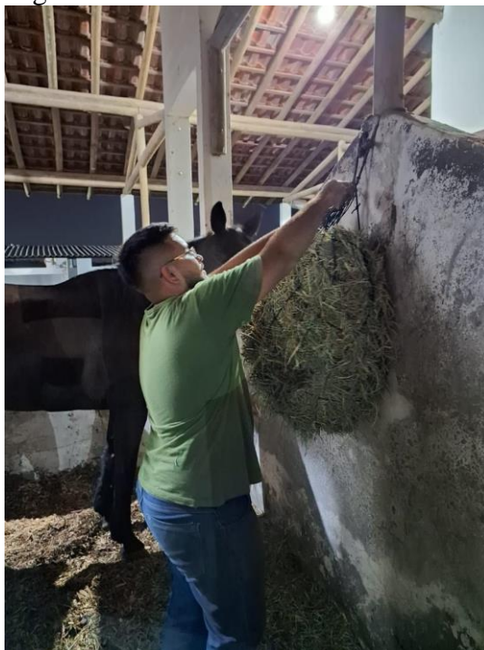
Figura 04- Fornecimento de feno

quilogramas, cada fardo era dividido em dez tabletes de aproximadamente um quilograma cada um, na primeira refeição de volumoso, os animais recebiam dois tabletes de feno, enquanto que na segunda recebiam cinco, totalizando sete quilogramas de feno diários.