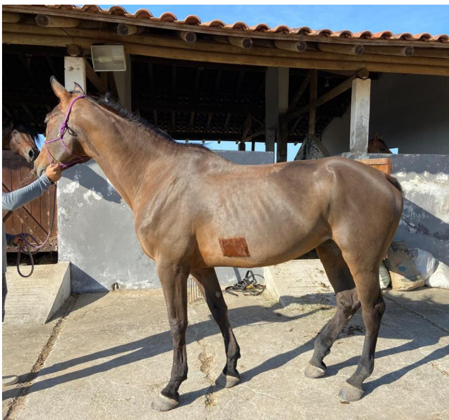
Figura 01- Brasileiro de Hipismo

Os equinos da raça Brasileiro de Hipismo (Figura 01) são animais de sela com aptidão para a prática esportiva das modalidades de Salto, Adestramento e Concurso Completo de Equitação, como caracteres morfológicos, os animais devem ser mediolíneos, de estrutura forte, linhas harmoniosas, caráter dócil, temperamento bom, grande facilidade para a reunião e andamentos briosos, ágeis, elásticos e extensos, sendo permitidas todas as pelagens em seus diferentes matizes ( Stud Book Brasileiro do Cavalo de Hipismo , 2015).