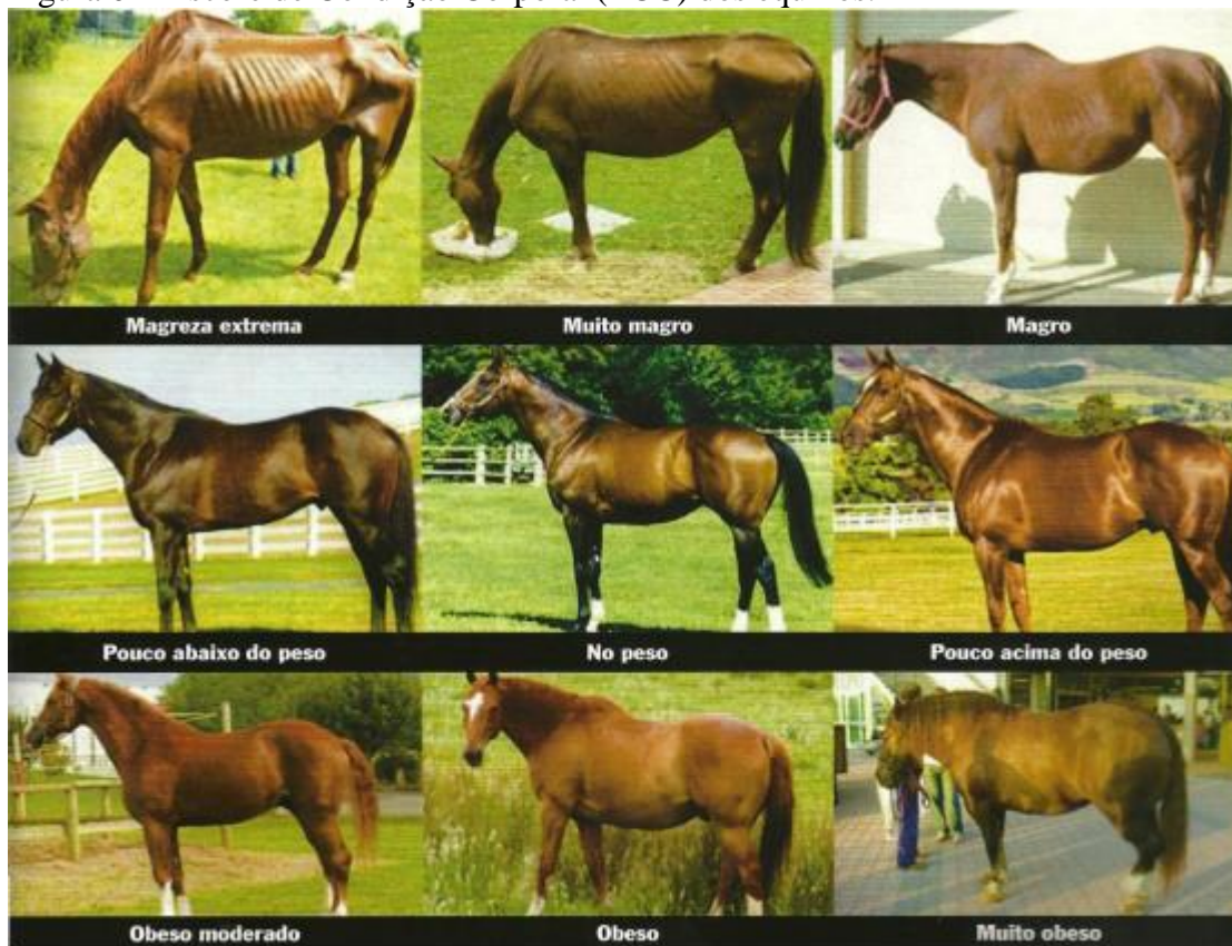
Figura 02- Escore de Condição Corporal (ECC) dos equinos.