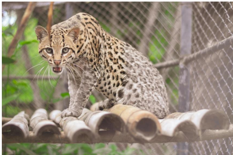
Figura 1 - Jaguatirica Fêmea, Zoológico Municipal Sargento Prata

Oliveira (2012) ressalta que as jaguatiricas são predominantemente crepusculares e noturnas (Emmons, 1988; Laack, 1991) com o grau de atividade diurna variando entre estudos (Di Bitettiet al., 2006) e parecendo aumentar na estação chuvosa e em dias com chuva (Murray & Gardner, 1997). Sua dieta é composta principalmente por pequenos mamíferos, podendo contudo, consumir aves, répteis e anfíbios em menor quantidade (Emmons, 1987; Murray & Gardner, 1997; Abreu et al., 2008). A maioria de suas presas possui massa corporal menor do que 1 kg, no entanto presas de maior porte, como veados, também podem fazer parte da dieta da jaguatirica em alguns locais, seja por consumo da carcaça (de Villa Meza et al., 2002) ou por ataque e subjugação (KONECNY, 1989).