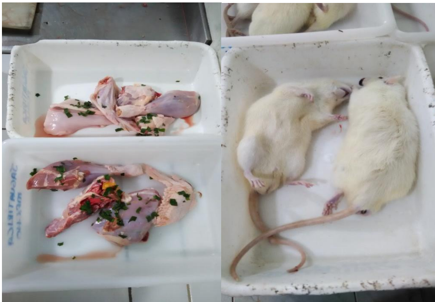
Figura 4A – Frango inteiro com capim; Figura 4B – Rato adulto

O regime de alimentação das jaguatiricas no Zoológico Sargento Prata funcionava da seguinte forma: 400 g de alimento diariamente (Tabela 2), porém não era especificada a quantidade e quais alimentos deveriam ser utilizados, assim, todos os dias existiam dietas específicas para ambos os animais. Devido a este fato, a alimentação das jaguatiricas poderia ser feita por um único alimento que compunha a dieta, frango inteiro (figura 3A ) ou rato adulto (figura 3B), dois alimentos ou em algumas vezes até por três alimentos diferentes.