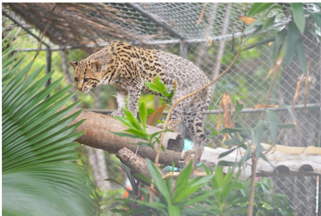
Figura 5 – Jaguatirica fêmea (detalhe), Zoológico Municipal Sargento Prata