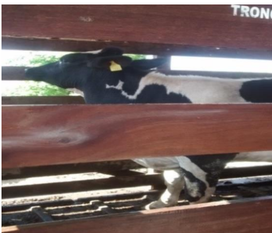
Figura 8– Pesagem dos animais

A dieta das novilhas consistia de uma dieta total composta de concentrado específico para a fase de recria, e volumoso (cana de açúcar picada), em cocho coletivo, sendo os animais divididos em lotes de acordo com o peso visando lotes homogêneos. As novilhas eram pesadas mensalmente (figura 8), para o acompanhamento do seu desenvolvimento até chegar ao peso de 350 onde eram inseminadas. É crucial que estes animais estejam com 82% do peso adulto (NRC 2001), no momento do parto para prevenir problemas no parto, além disso, segundo Sousa (2009), há forte correlação entre peso vivo ao primeiro parto e produção de leite à primeira lactação .