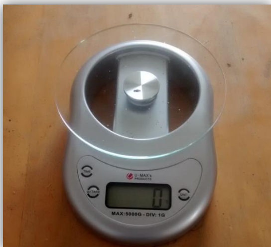
Figura 19 – Balança