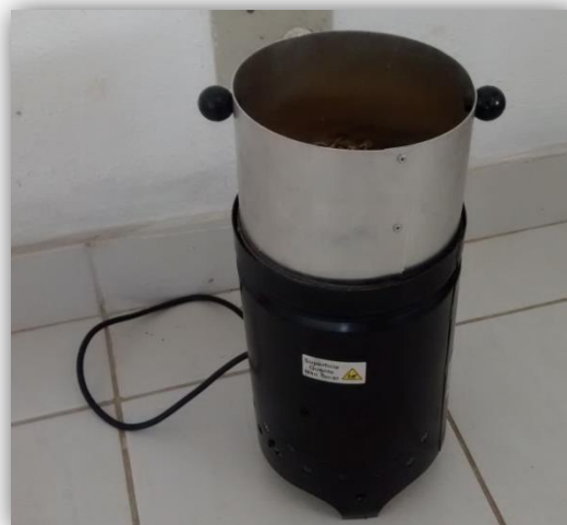
Figura 20 – Aquecimento da Silagem