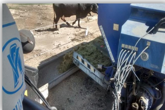
Figura 17 – Fornecimento da dieta