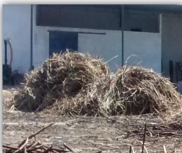
Figura 11 – Cana de açúcar com palha