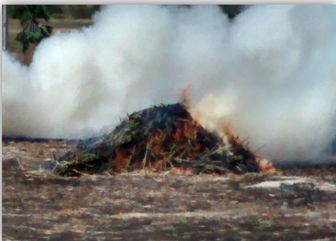
Figura 14 – Queima da cana de açúcar