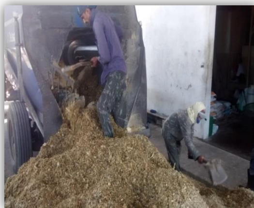
Figura 13 – Silagem de milho