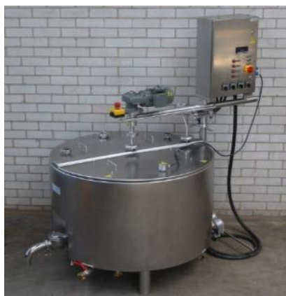
Figura 4 – Pasteurizador

Nas fazendas, onde se utilizava este sistema, observou-se uma significativa diminuição de diarreias, aumento no ganho de peso até a desmama, redução do uso de medicamentos para as crias, diminuindo os custos na criação de bezerros, que é uma etapa de custos elevados.