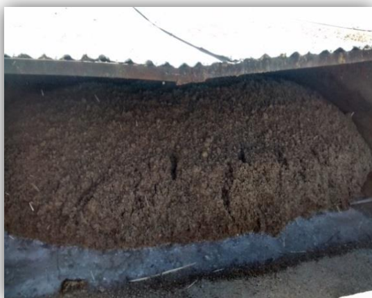
Figura 12 – Cevada