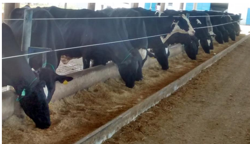
Figura 18 – Alimentação de vacas no cocho

de cálcio e reduz a incidência e a prevalência de hipocalcemia (COBELLINI, 1998). Um dos principais objetivos da utilização de dietas aniônicas em vacas no pré-parto, é controlar a hipocalcemia subclínica, febre do leite ou paresia puerperal (CAVALIERI & SANTOS, 2001).