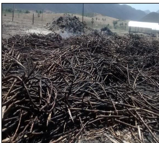
Figura 10 – Cana de açúcar queimada