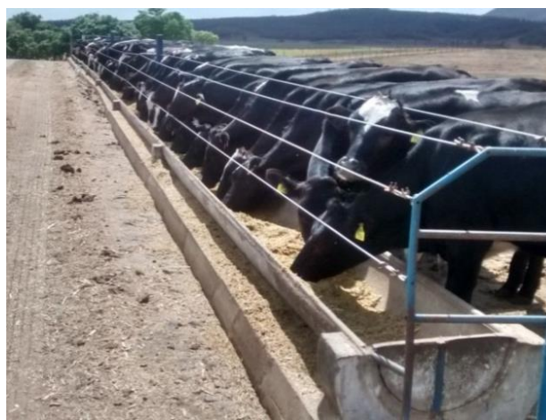
Figura 9 – Novilhas