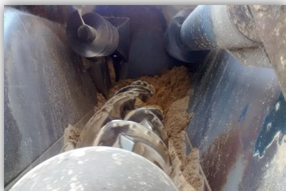
Figura 16 – Mistura da dieta no vagão