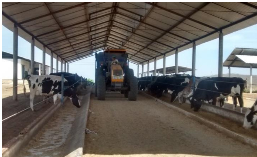
Figura 15 – Fornecimento da dieta