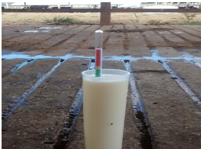
Figura 5 – Teste do colostrômetro

intervalo de 20 – 50 mg/ mL; e excelente (verde) para valores de Ig maiores que 50 mg/mL.