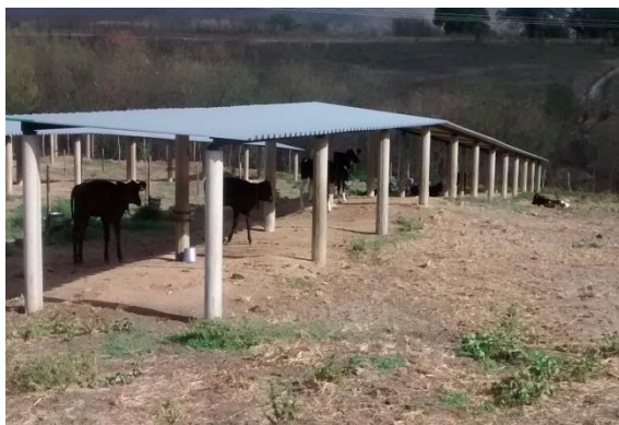
Figura 6 – Bezerreiro tipo Argentino

O bezerreiro da propriedade é do tipo argentino (figura 6) que consiste em as bezerras ficarem presas a um fio com 8 a 12 metros de comprimento, que as permite correr de um lado para o outro e diminuir o acúmulo de matéria orgânica e umidade. A água fica separada da ração. O sombrite, é posicionado no sentido norte - sul. Assim, a luz solar, ao incidir de leste a oeste, desinfeta toda a área em que a bezerra está e, ao mesmo tempo, fornece sombra o dia todo, porém, em locais diferentes, de acordo com a posição do sol.