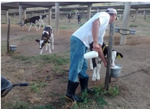
Figura 7– Aleitamento dos bezerros