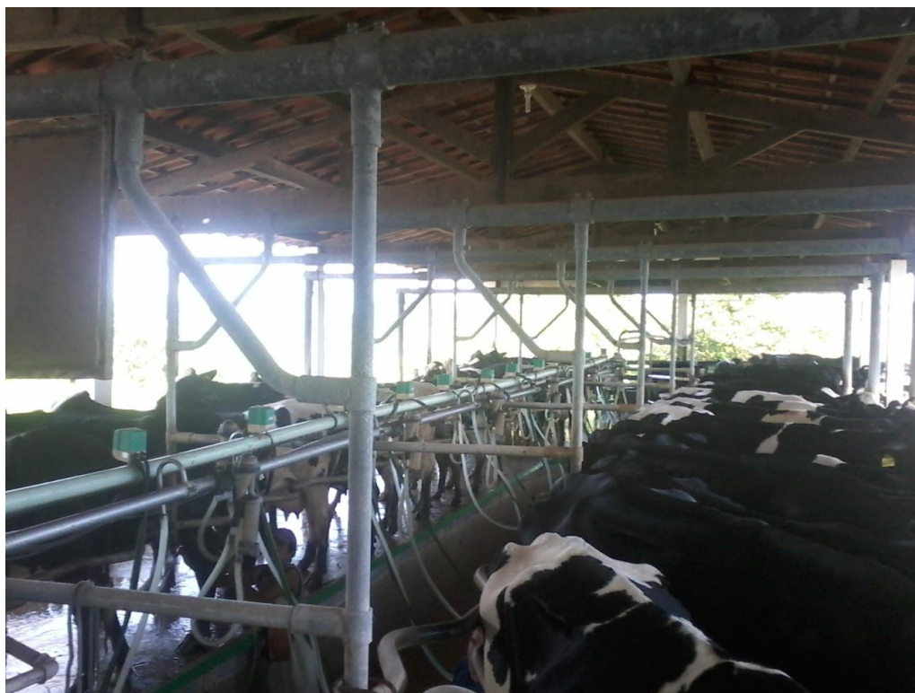
Figura 4: Animais sendo ordenhados

sala de ordenha e sala de espera feita com vassouras e jato jato de água sob pressão.