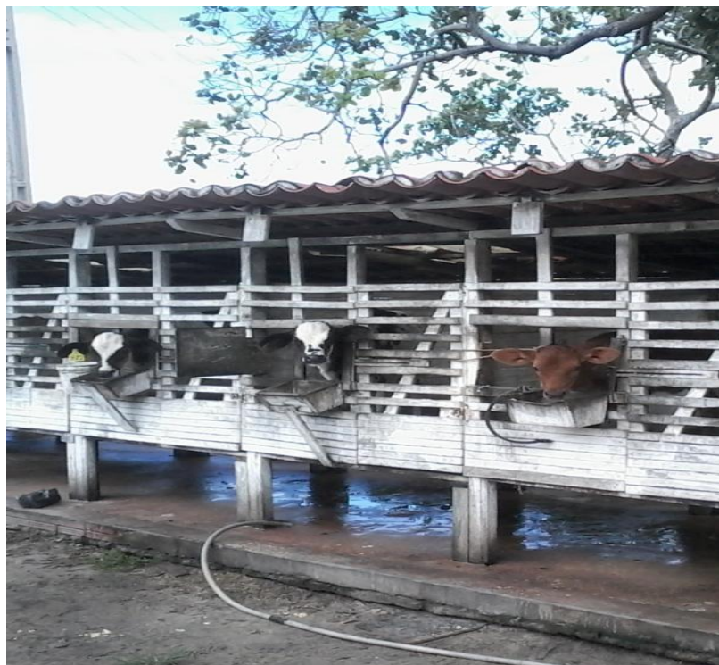
Figura 1: Bezerreiro individual

permanecerão nos bezerreiros individuais até completarem 60 dias irão para uma instalação denominada bezerreiros coletivos.