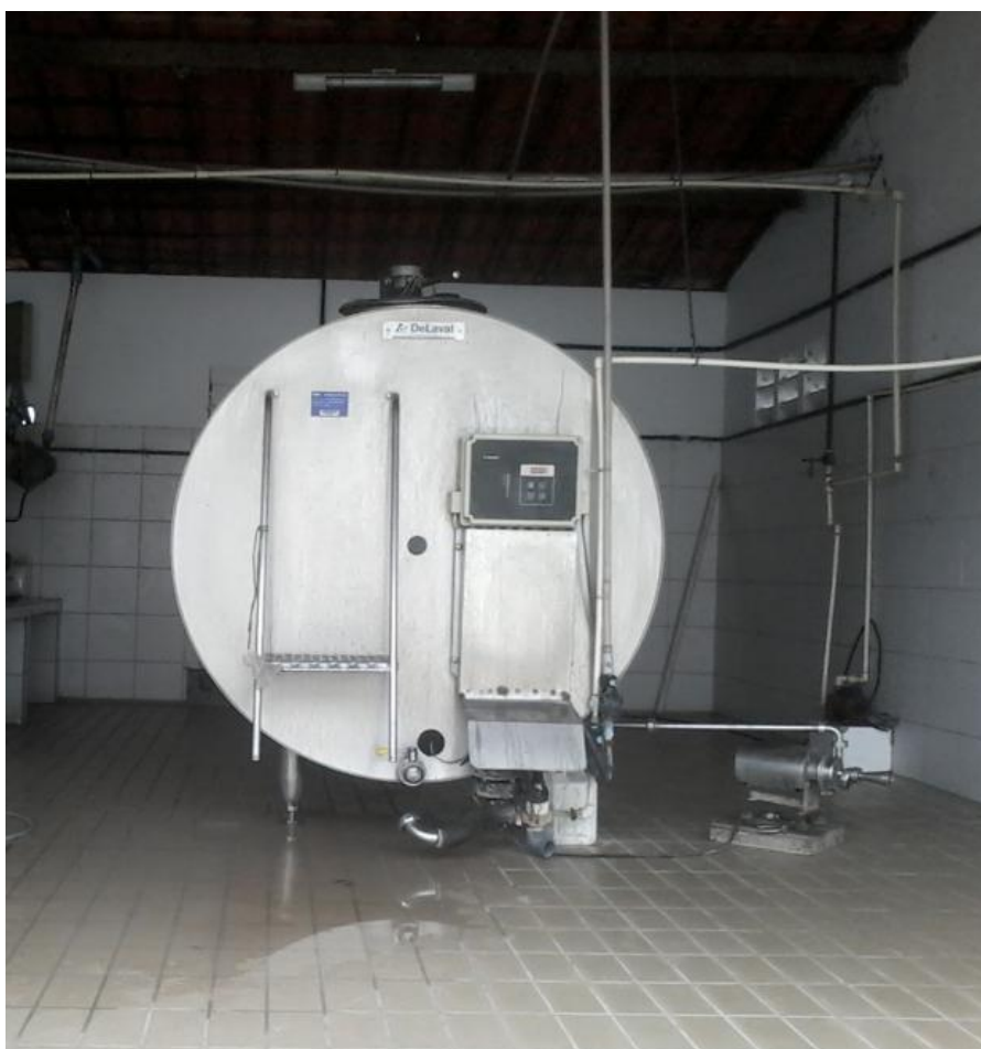
Figura 5: Tanque de Resfriamento.

O controle leiteiro na fazenda Lagoa do Mato é realizado a cada 15 dias, observou-se que a produção média diária de cada vaca é de 8 litros/vaca/dia. A produção de leite da fazenda é recolhida pela empresa Danone em dias alternados.