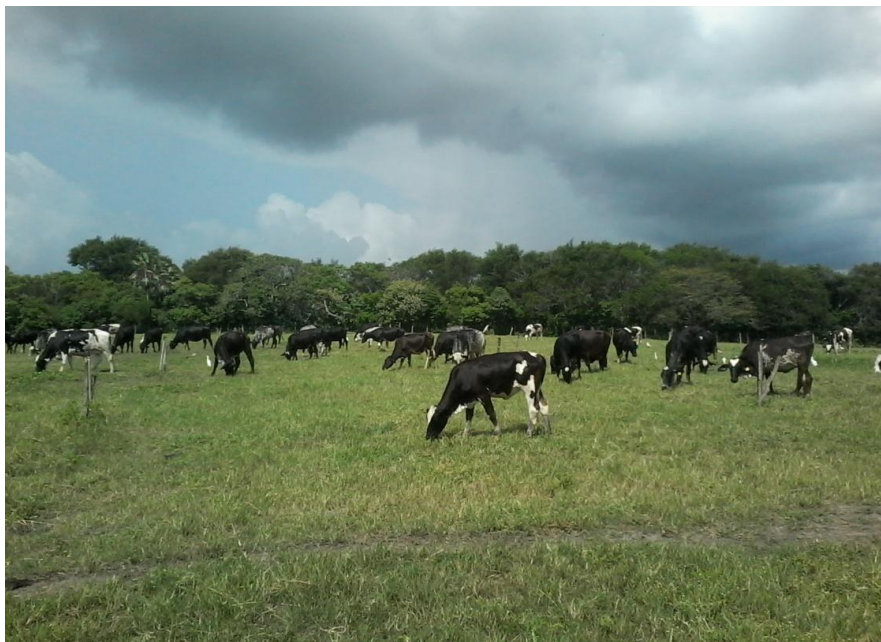
Figura 2: Animais na fase de recria no pasto no período chuvoso

O próximo manejo a saída das bezerras da baia coletiva indo para o lote de novilhas, consideradas segundo ao aspecto reprodutivo, chamadas de pré-púberes, isto é, animais que já serão preparadas para cobertura. Com o sistema de alimentação sendo fornecida no cocho e a pasto no período chuvoso. As novilhas continuam nesse lote até completarem 320 kg onde estão aptas a serem inseminadas, conforme, a observação de cio ou irão diretamente para o grupo de Inseminação Artificial em Tempo Fixo (IATF).