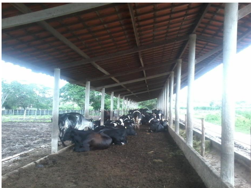
Figura 6: Galpão de novilhas

A instalação para novilhas é feita de alvenaria com piso de concreto antiderrapante com telhado de barro e boa área à sombra proporcionando um bom conforto térmico. O comedouro e bebedouros são feitos de barro.