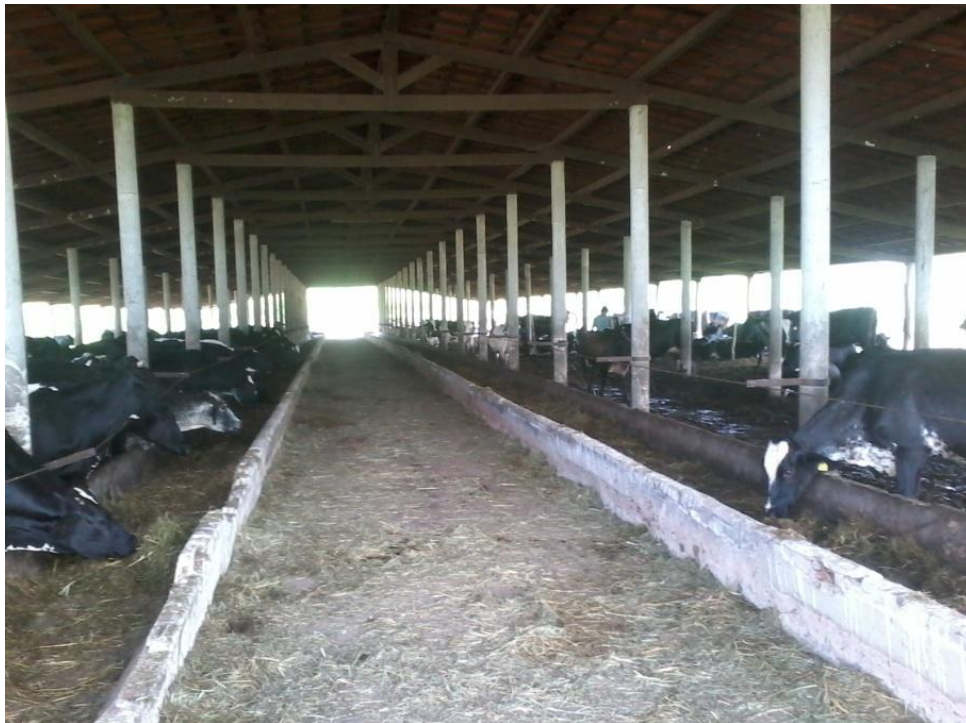
Figura 3: Galpão dos animais em lactação.

O alimento volumoso fornecido aos animais é o capim Mombaça ( Panicum maximum ) e o concentrado a base de milho grão moído, farelo soja, calcário, ureia e sal. O concentrado é fornecido em quantidade de 1 kg para cada três litros.