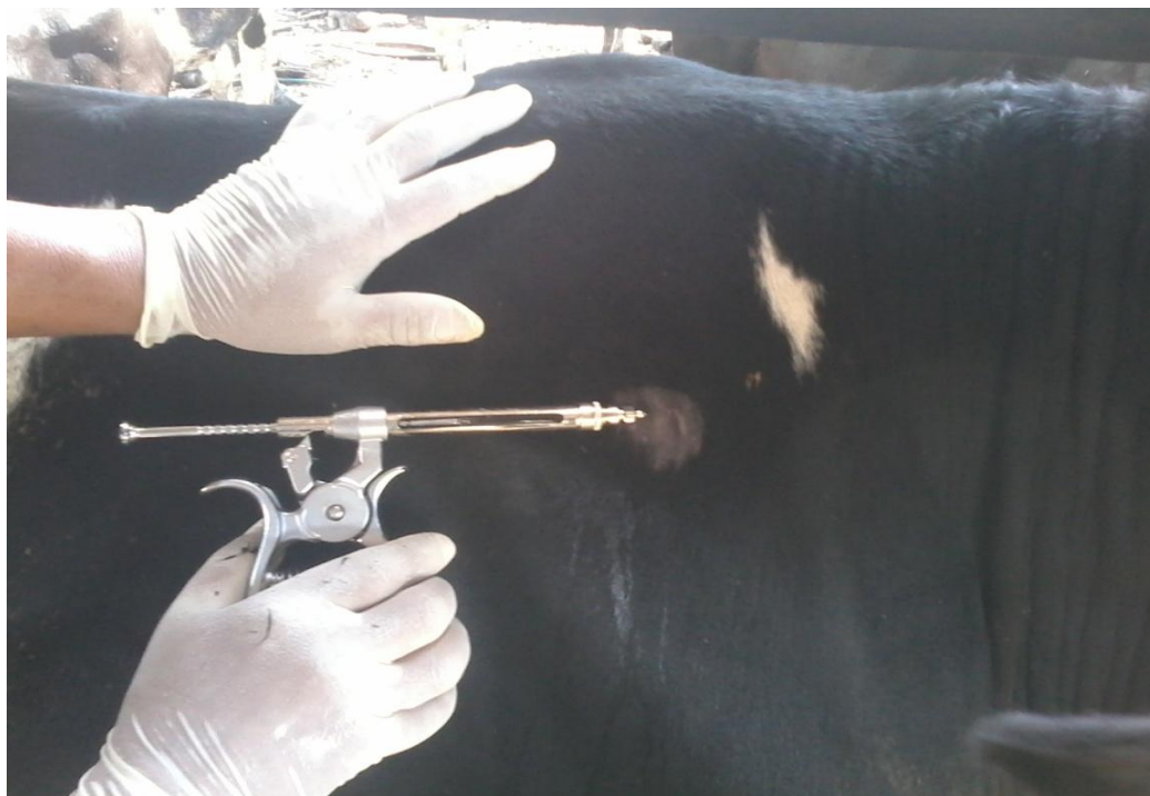
Figura 8: Exame de Tuberculose: Aplicação da tuberculina