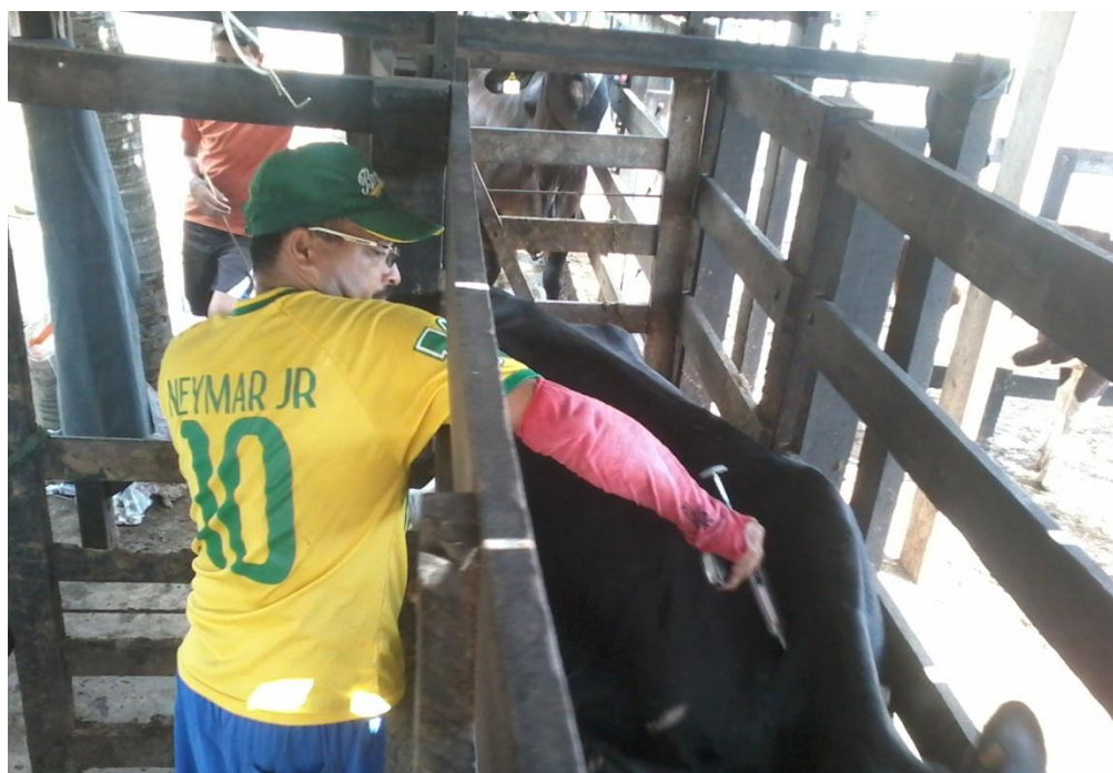
Figura 8: Vacinação contra Febre Aftosa