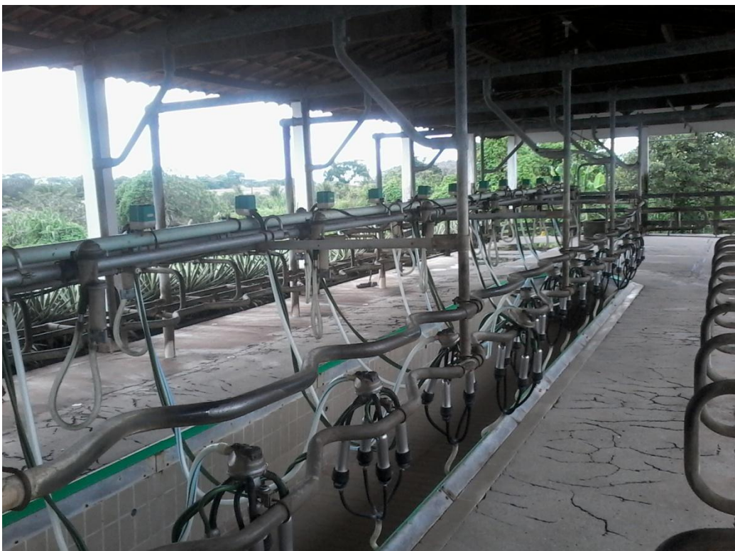
Figura 7: Sala de Ordenha.

A fazenda possui outros anexos como galpão de máquinas, sala de leite, usina para processamento do leite que está desativada e escritório.